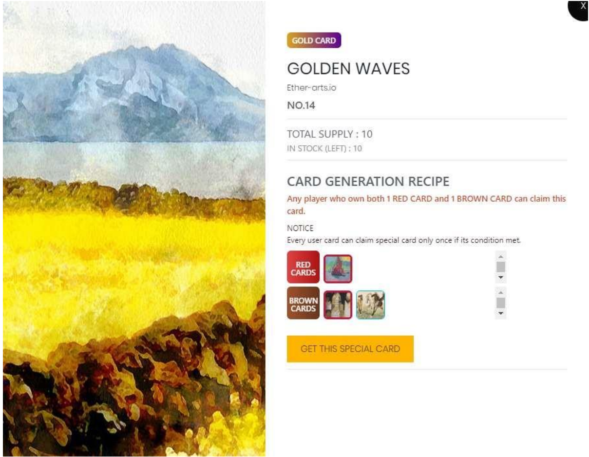
الشكل 1. وصفة البطاقة الخاصة (مثال)

لأن الحد الأقصى لعدد البطاقات الذهبية هذه هو 10، فلا يمكن المطالبة بهذه البطاقة أكثر من 10 مرات.