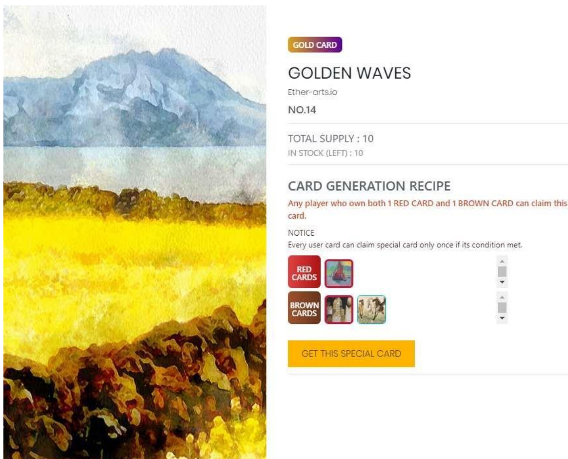
Fig 1. Recette de carte spéciale (exemple)

Cette carte ne peut pas être réclamée plus de 10 fois.