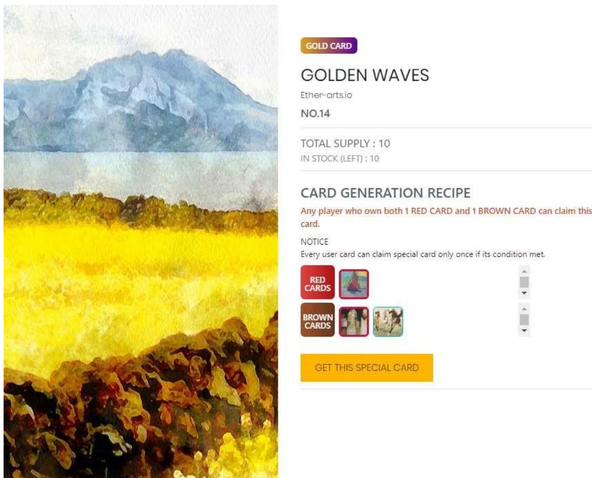
Rys 1. Receptura specjalnej karty (przykład)

Gracz z pojedynczą CZERWONĄ kartą i pojedynczą BRAZOWĄ kartą może zażądać karty ZŁOTEJ. Nawet jeśli zgodziłeś się na kartę ZŁOTĄ, twoja CZERWONA i BRAZOWA karta jest nadal twoją. Nie zostanie usunięta ani wyłączona. Maksymalnie ZŁOTĄ kartę można odebrać 10 razy.