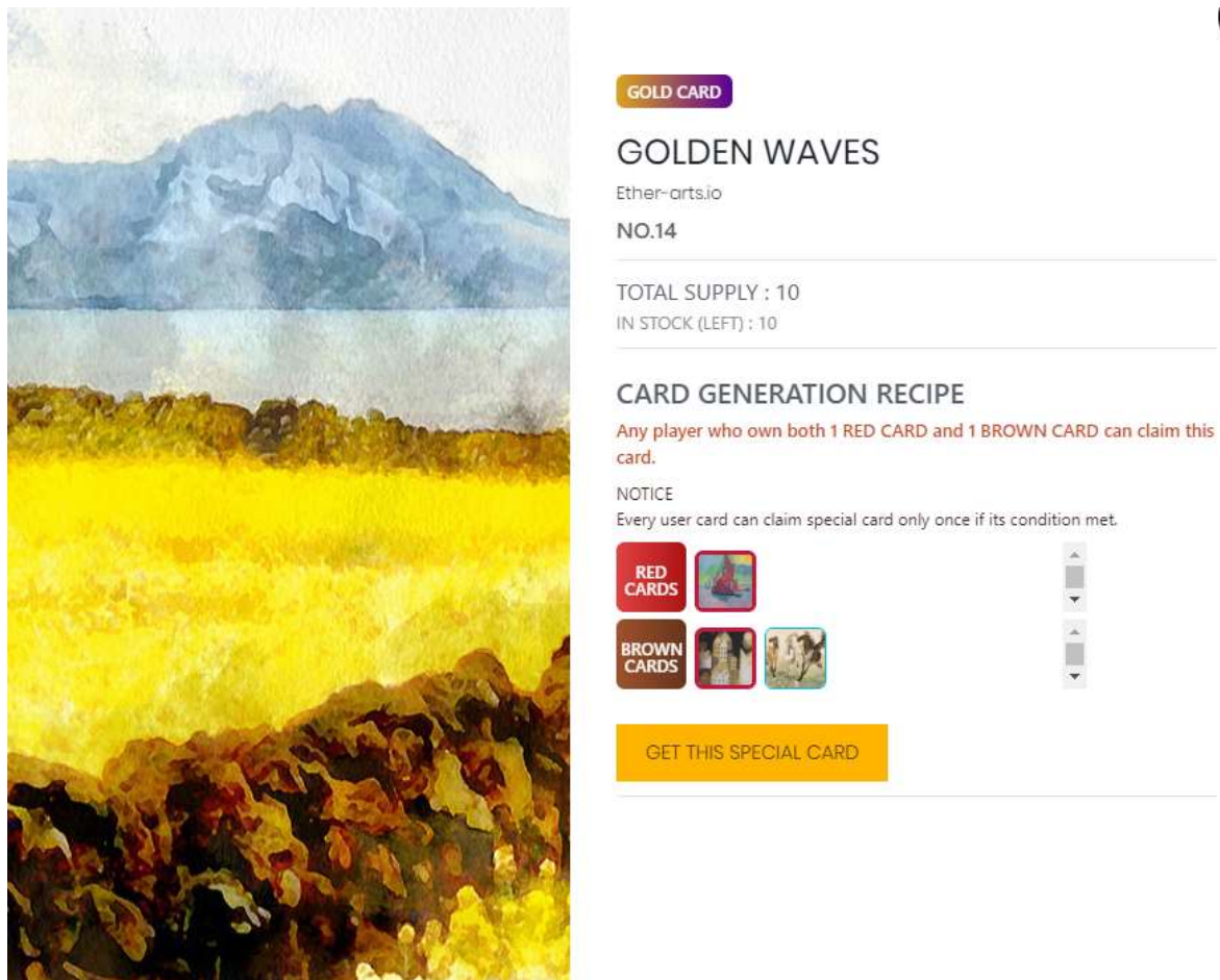
Fig 1. Special card recipe (example)

of this GOLD cards is 10, this card couldn't be claimed more than 10 times.